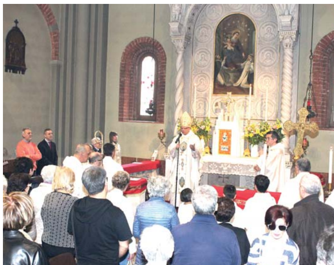
Una celebrazione in Abbazia S. Benedetto

Inoltre è significativa la presenza della vita consacrata attraverso diversi carismi: Monaci Olivetani, Adoratrici Perpetue del SS. Sacramento, Comunità di S. Luigi Orione, Figlie della Carità di S. Vincenzo De' Paoli, Figlie della Carità di S. Maddalena di Canossa, Suore di S. Anna).