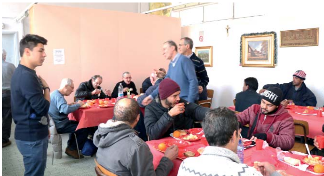
La mensa della solidarietà in attività da anni

Esistono alcune proposte atte ad accompagnare situazioni di fatica nella vita delle famiglie: il Consultorio Familiare; il Gruppo "Akor", per le coppie in situazioni difficili, organizzato dalla Diocesi e con sede, per la nostra Zona Pastorale, presso il Collegio Ballerini.