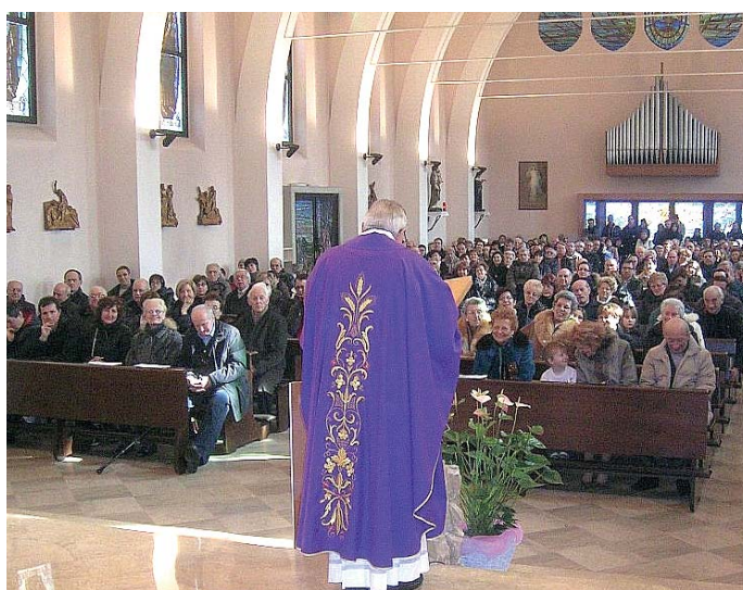
Una celebrazione al Don Orione