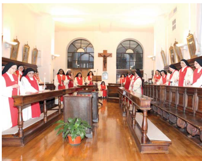
Le suore adoratrici del SS. Sacramento