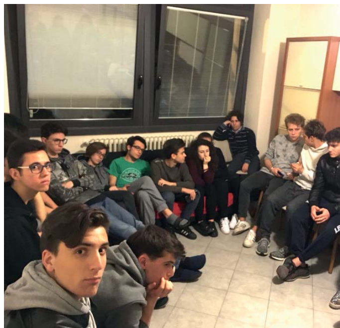
I giovani durante una 'vita in comune'

Nel nostro contesto culturale si percepisce una certa fatica che talvolta tende alla rinuncia, anche a partire dal fatto che la figura dell'adulto non sempre riesce a essere un riferimento autorevole. Inoltre, un'ulteriore sfida educativa è costituita da un diffuso accrescimen-