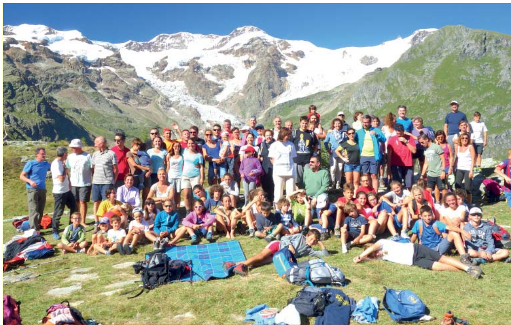
Una vacanza dei gruppi famiglia

Cinque azioni trasversali prioritarie da condividere il più possibile a tutti i livelli: evangelizzare, celebrare, educare, camminare insieme, uscire.