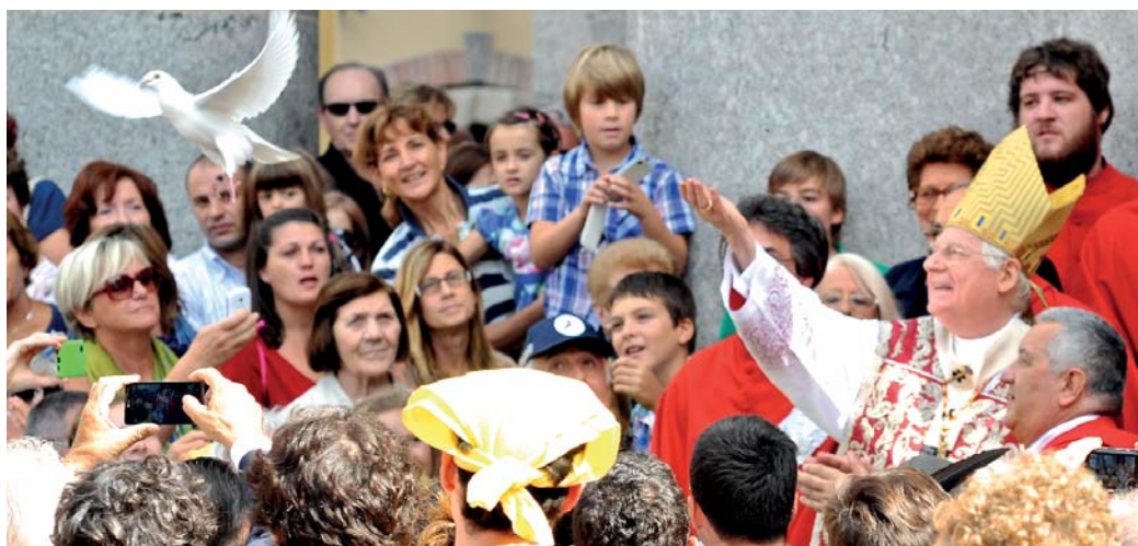
La visita dell'arcivescovo Scola nel 2014 per l'inizio della Comunità