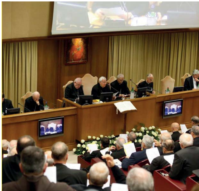
L'assemblea dei vescovi italiani